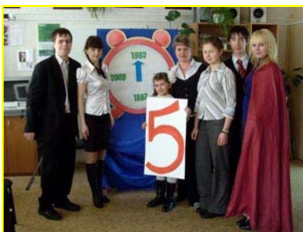
Ансамбль народной песни «Красное солнышко», 1 место на городском конкурсе